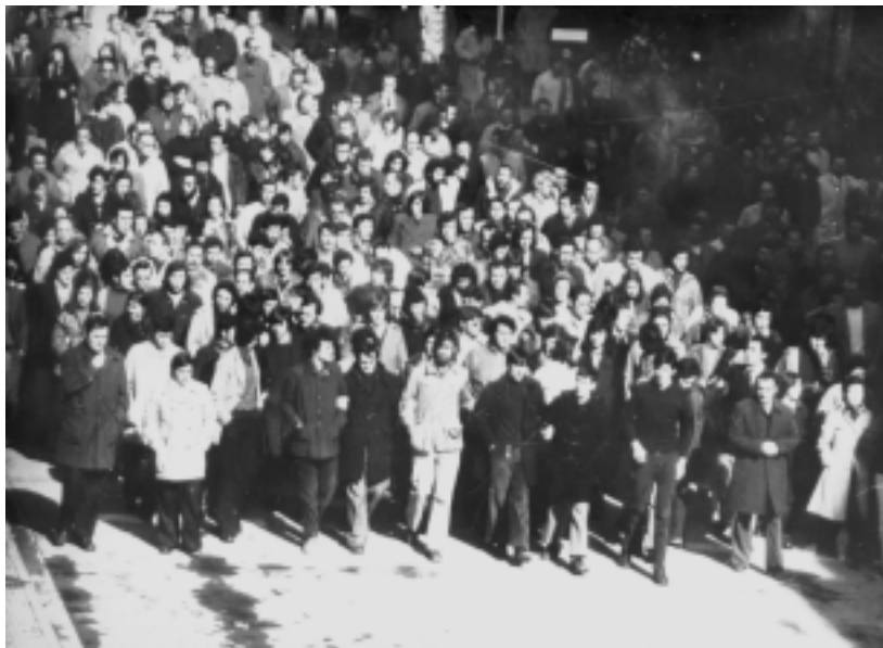
Miles de trabajadores y de jóvenes participaron en una marcha en el funeral de los compañeros asesinados

El 3 de marzo de 1976, cinco trabajadores fueron asesinados y 200 heridos de bala. Fraga y otros responsables políticos del franquismo ordenaron a la policía disparar a bocajarro para disolver una asamblea en la iglesia de San Francisco, en Gasteiz, en plena huelga general. Fue uno de los momentos más significativos de la llamada "transición". El pacto de silencio que se impuso entonces ha llegado hasta hoy: ningún responsable ha sido juzgado por los hechos y se ha querido someter a las víctimas al olvido. Reproducimos el artículo de un compañero que recuerda los hechos y sigue en la lucha por los derechos de los trabajadores y de los pueblos.