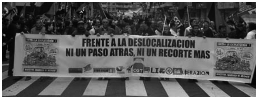
Manifestación en Zaragoza del sector de la automoción, de CGT

Los críticos de CCOO están en un círculo vicioso que sólo puede romperse con la defensa de los puestos de trabajo hasta el final, de los métodos de lucha obrera (huelgas y asambleas decisorias) y fundamentalmente con la lucha por revocar de sus puestos de dirección a los sindicalistas burocratizados y su sustitución por luchadores, como por ejemplo esta haciendo la Corriente de opinión en la comarcal de Girona. El problema de SEAT no es que los críticos "sólo" agruparan el 47%