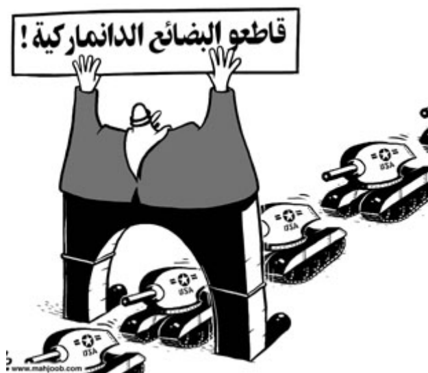
Los Gobiernos árabes se movilizan contra las caricaturas, pero no contra las amenazas imperialistas

Desde luego que no podemos permitir cualquier limitación sobre la libertad de expresión, una libertad que en Europa se ganó al precio de la sangre de la clase obrera; hoy está costando lo mismo para los pueblos musulmanes en su lucha contra sus propios gobiernos dictatoriales y colaboradores del imperialismo. Sin embargo, presentar el conflicto sobre los dibujos como un sí o no a la libertad de expresión es la falsedad que querría fomentar el imperialismo. La libertad de expresión no es insultar a las minorías oprimidas por razón de sexo, raza o religión, sino contar con una serie de garantías para protegerse dentro de lo posible de las represalias que toma el poder cuando se le cuestiona. Y la publicación de las caricaturas en Dinamarca no