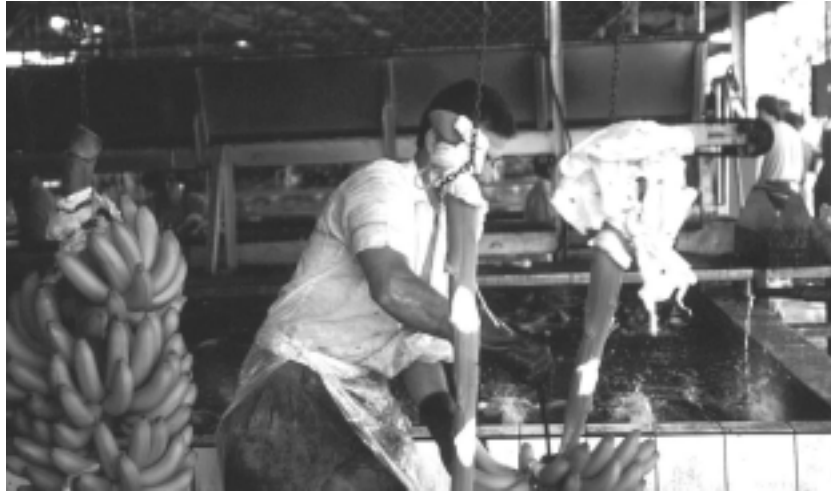
Plantación bananera en Costa Rica