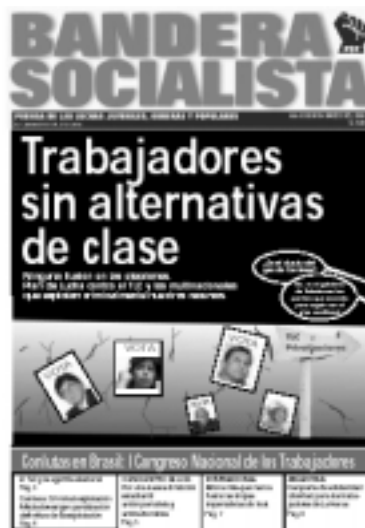
Portada de la revista del PST

Contra Humala también se ha alineado un amplio espectro de la burguesía y la intelectualidad