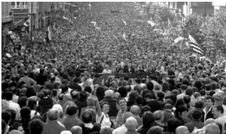
Ochenta mil manifestantes en Bilbao, el 1 de abril

se abrían: el de los acuerdos del Viernes Santo de Irlanda y el de Oslo palestino. Las imágenes de Jerry Adams dirigente del Sinn Fein y Arafat dirigente de la OLP, figuraron en los carteles de HB como referentes de negociaciones. Incluso hoy la referencia de Irlanda está viva y se presenta al reverendo Alec Reid, mediador de ese conflicto, como protagonista especial de entrevistas y actos en el actual proceso vasco. En ambos casos de negociaciones de paz, los procesos abi-