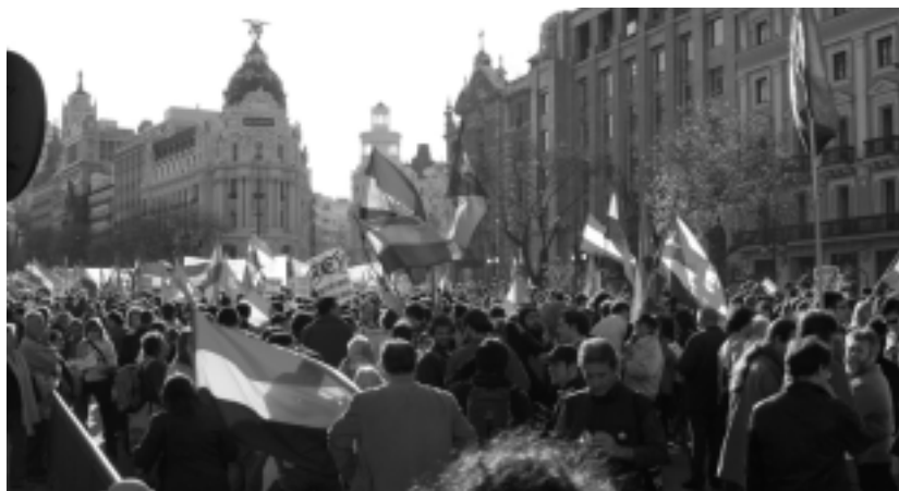
COLECTIVO QUIERES CALLARTE

Pero es en el País Vasco donde la negación del derecho de autodeterminación adquiere su faz más violenta. Allí la sistemática represión no se ha detenido ni con el anuncio del alto el fuego permanente de ETA quedando al desnudo la "legalidad" antiterrorista levantada no contra ETA sino contra un sector de la población que reivindica este derecho y al que le es negado derechos democráticos tan elementales como son los de reunión, expresión o simplemente pensamiento. Ciertamente una consti-