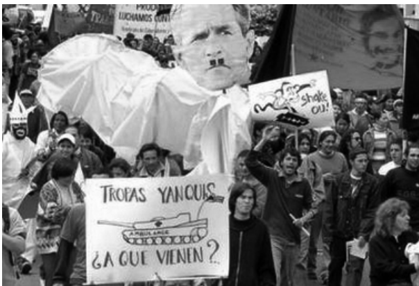
Manifestación en Asunción contra la base de EEUU

Comité Ejecutivo Partido de los Trabajadores - PT (sección paraguaya de la LIT-CI)