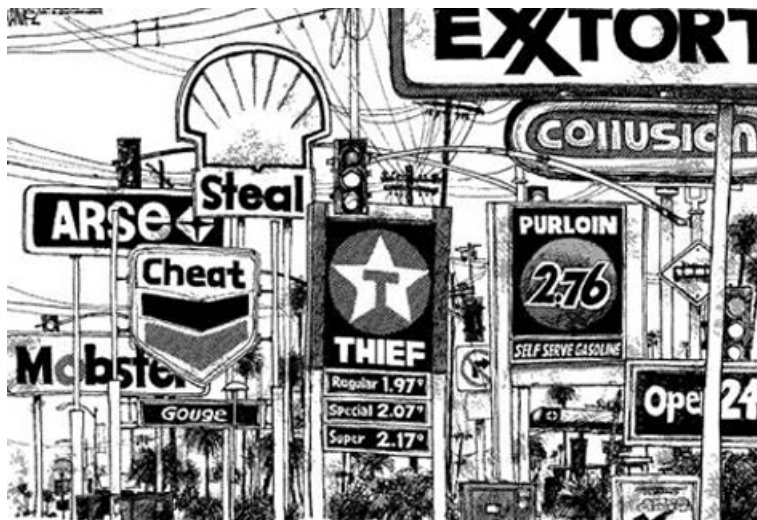
Extorsión, robo, ataque, estafa, hurto