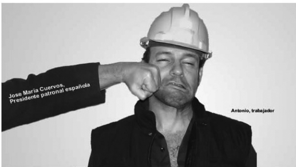
Jose María Cuervos, Presidente patronal española

Vale, ya lo entiendo, antes se llamaban "servicios públicos", pero "servicios de interés económico general" está más cerca de la privatización, y sin mucho alboroto, ¿no? Y atención: la UE no garantizará el acceso a estos servicios, solo los ' reconocerá y respetará ', como quien te da unas palmaditas en la espalda... y los dejará a la voluntad de cada país.