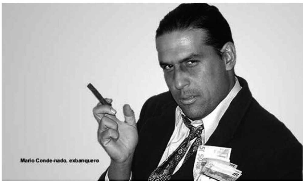
Mario Conde-nado, exbanquero