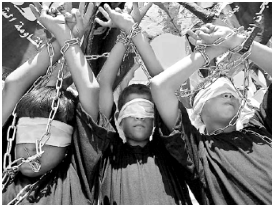
Manifestació a Gaza en suport als presos. Agost 2004

El context en què ens situàvem en arribar a Palestina era el d'una lluita recent dels presos polítics que havia acabat el setembre de 2004 (vegeu el LI 53). Des del 15 d'agost, 8.000 presos i preses polítics palestins van declarar-se en vaga de fam. Demanaven que ells i les seves famílies fossin tractats segons la llei i els tractats dels Drets Humans. Condicions higièniques bàsiques, atenció mèdica, visites de familiars, la fi de les pallisses i tortures indiscriminades. Aquella lluita – encara que es limitava a