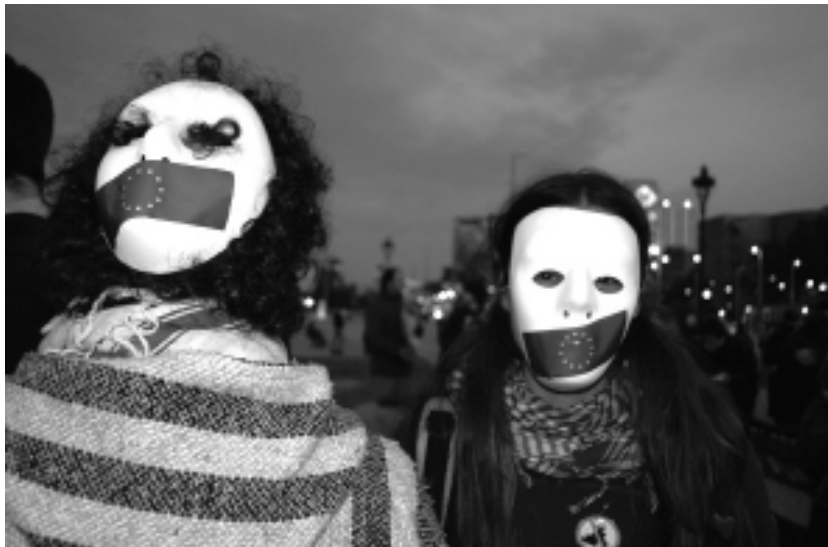
Protesta a Barcelona per la presència de Zapatero, Schroeder i Chirac

El Govern va utilitzar tots els recursos antidemocràtics per imposar el Sí. Va aprovar quantitats multimilionàries per a la seva campanya electoral: 8 milions d'euros pel Govern i 9 milions pels partits parlamentaris - dels quals només 735.758 van anar a parar als partits del No, és a dir, una proporció de 18 a 1 a favor del Sí. El Govern va ser tan descarat en la campanya pel Sí que fins i tot va arribar a cridar-lo a l'ordre la Junta Electoral, però tampoc per això va canviar d'actitud. La majoria absoluta de mitjans de comunicació va en el Sí. Fins i tot en ple "dia de reflexió" i en el de la votació, durant els quals se suposa que està prohibit fer campanya, El País treia un editorial "pel Sí"; però no va ser l'únic, van seguir-lo, com a mínim, Tele 5, El Mundo, Cinco Días i Expansión, tal com s'exposa en la denúncia presentada a la JEC per "Una altra democràcia és possible".