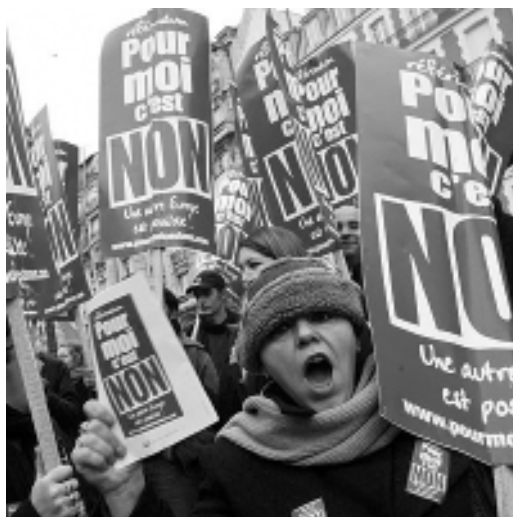
Mobilització a París per defensar les 35 hores

De l'altra perquè la correlació de forces no és la mateixa, essencialment pel no de la principal central sindical, la CGT, seguida de moltes federacions de FO, que deixen sola - seguint les directrius de la CES- pel sí, la CFDT. També pel no es posicionen els partits d'esquerra des del PC, als 4 partits trotsquistes LO, LCR, PT i la