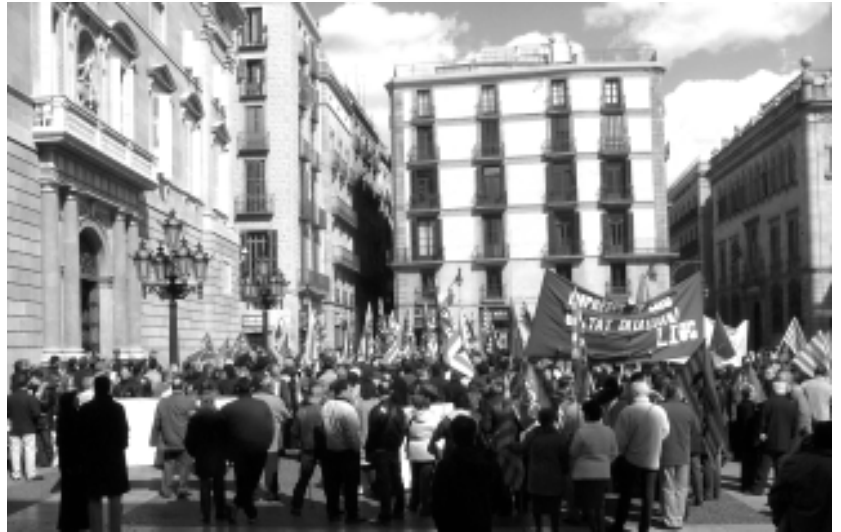
Manifestació de Miniwatt el 6 de març

A la recerca denostada per l'augment de la plusvàlua s'afegeix l'especulació immobiliària: els terrenys tenen un valor de 200 milions d'euros -més del doble de fa dos anys- gràcies al Projecte Pla