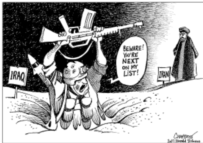
"Atenció ets el següent de la meua llista"

Com a conseqüència inevitable d'una invasió que enfronta una resistència armada amb suport massiu, tot habitant del país ocupat (home, dona, avi o infant) és un enemic potencial que cal derrotar perquè no entén que "venim a alliberar-los". Es fa necessari, llavors, apel·lar a mètodes cada vegada més cruels: milers de "sospitosos" presoners, tortures, violacions, atacs genocides a poblacions desarmades. Es calcula en més de 100.000 les víctimes civils iraquianes per la invasió i l'ocupació. Però cadascun d'aquests fets augmenta l'odi a l'invasor i el suport a la resistència i, amb això, la necessitat d'aprofundir aquests mètodes, en un espiral infernal, sense que es vegin