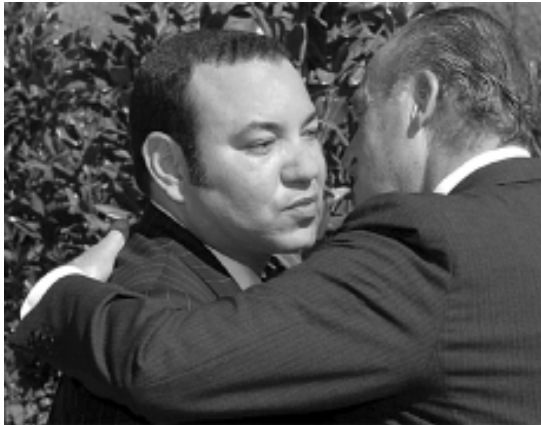
Els reis de Marroc i d'Espanya

En diverses universitats del país va començar el febrer una vaga d'exàmens per a frenar la reforma que pretén imposar el govern, obeint