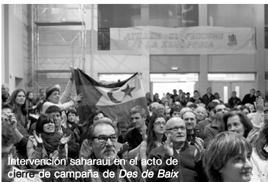
Intervención saharauí en el acto de cierre de campaña de Des de Baix