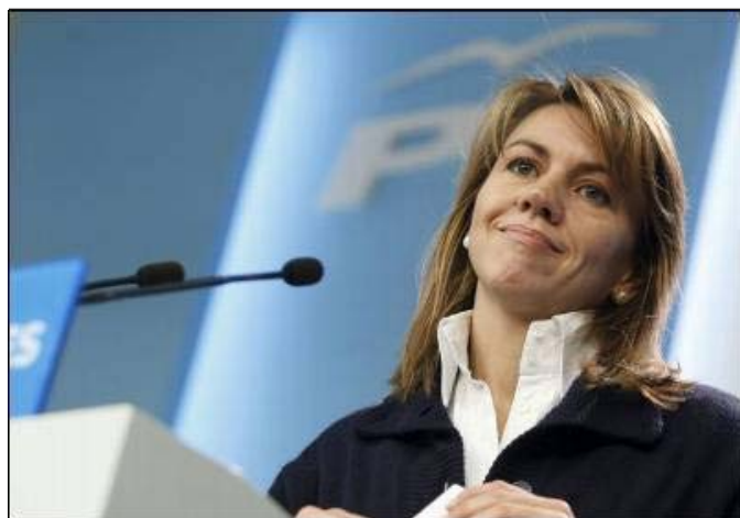
M. Dolores de Cospedal, del PP: 165.000 euros anuales ...sólo 13.700 al mes

que el fichaje de Kaka: unos 59 millones. Cobran idéntico que los diputados y tienen las mismas ayudas y subvenciones, portátiles, móviles, asistentes por grupo parlamentario... Tanto senadores como diputados tienen derecho a una pensión parlamentaria del 80% en los mismos términos que el presidente y ministros, el exparlamentario que en el momento de su cese tenga 55 años y el pobrecito carezca de una actividad profesional o laboral permanente -este es el diputado o senador gandul- tiene derecho a que las Cortes le paguen la seguridad social hasta que complete el periodo de cotización para cobrar la jubilación. Además en el caso de que no vuelvan a ser elegidos diputados o senadores tienen una indemnización igual al salario de un mes por cada año de diputado o senador. Si el exdiputado o exsenador fallece, su familia recibe en un pago único una indemnización de dos meses de su salario por año como parlamentario. Si algún exparlamentario no llega a 7 años de mandato tiene derecho a una ayuda de carácter graciable que establecerá la mesa del congreso.