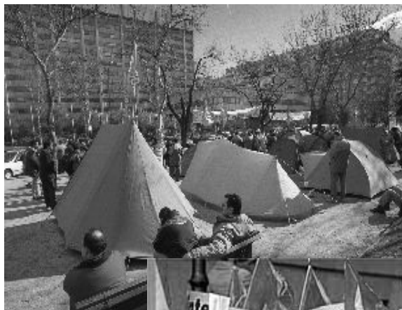
Acampada en el P. de la Castellana y masiva manifestación en Madrid el 10/5/01

Parece que hay ciertos avances. El Comité de Sintel está teniendo reuniones con la Administración y Telefónica para intentar buscar una salida, no obstante, siguen fuertes en la lucha y no se fían. Las reuniones han sido convocadas por la administración, pues tanto a la Administración como a telefónica no les interesa verse implicados y que la cosa se alargue, ya que ante una previsible recesión económica y ante los despidos que puedan haber sigan el ejemplo de Sintel