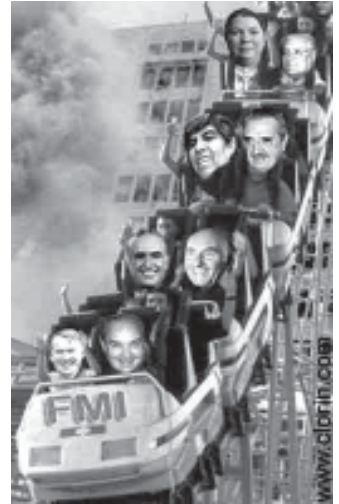
(Algunos políticos argentinos en un viaje de riesgo. Tomado de Claryn, una web satírica)