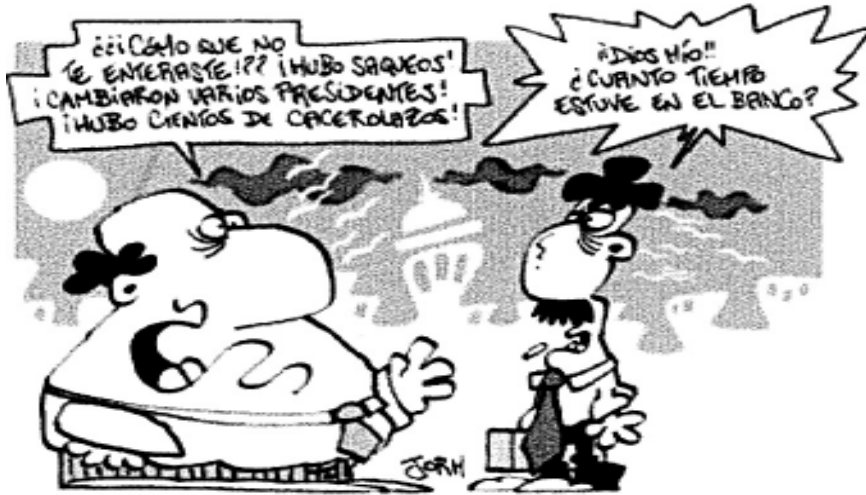
(De Página 12)