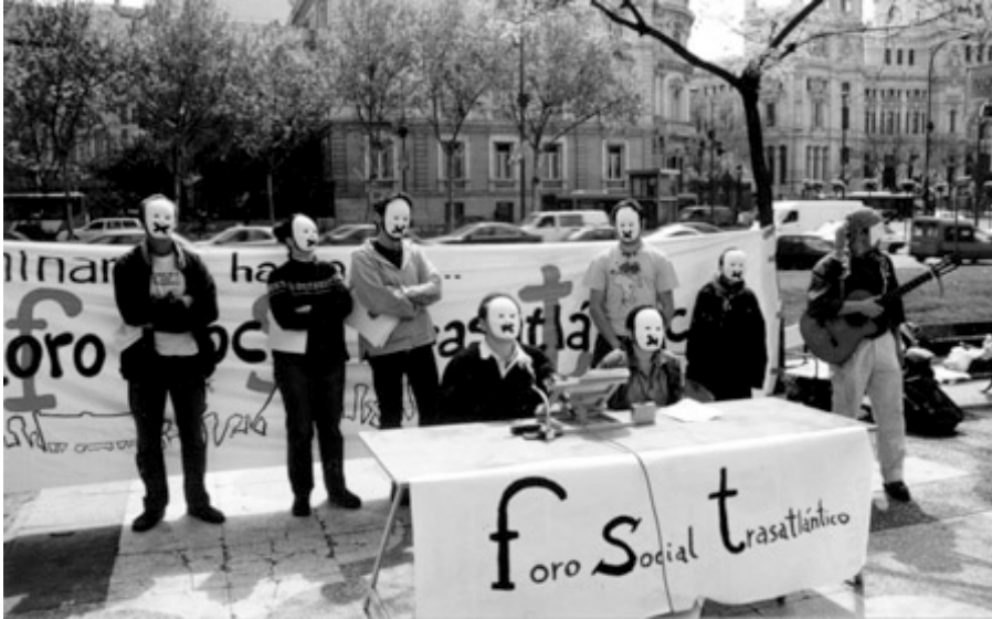
Presentación del FST en Madrid. En defensa de las libertades

), convierten el proyecto de ilegalización en un acto mas de manipulación de la opinión pública y secuestro de la soberanía popular.