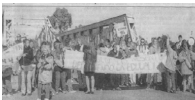
Piquete docente cortando el puente de acceso a Rawson (capital de la provincia). 18/4/02

Al cerrar esta edición, los docentes de la provincia del Chubut siguen en huelga indefinida, a pesar de haber cobrado sus haberes, exigiendo el acondicionamiento de las escuelas que garantice la seguridad, higiene y material para los alumnos.