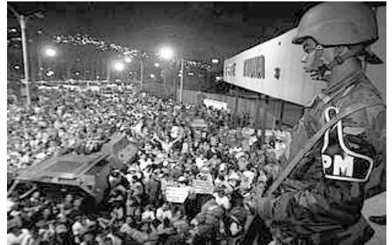
Movilización en la base de Tiuna, donde estaba detenido Chávez

No sólo no fue así, sino que la CTV y Fedecámaras la convirtieron en indefinida.