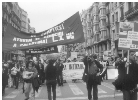
Barcelona, 14/4/02. En la mani fuimos 30.000