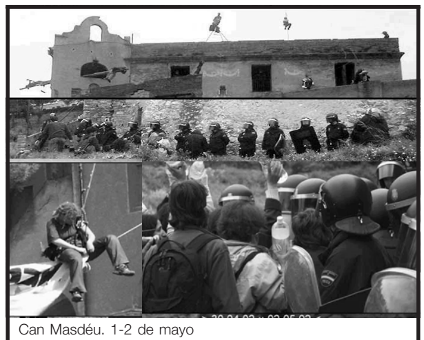
Can Masdéu. 1-2 de mayo

bastante bestia en los '70 y los '80 y esto nos ha ayudado. Antes de okupar hicimos una reunión con la Coordinadora de Asociaciones de Vecinos y Entidades del barrio. También estamos formando parte de la creación de la Plataforma Cívica por la Conservación de Collserola, y tenemos contacto con la Federación de Asociaciones de