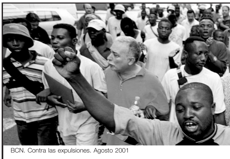
BCN. Contra las expulsiones. Agosto 2001

de ese congreso del Metal en Catalunya en que yo defendí la política de pactos y salí secretario general, viene otro y me presento a la reelección, cambiando el discurso: lo he visto con mis ojos, no es teoría. Pero ya CCOO ha entrado en los pasteleos. (...) Lo escribo como informe de gestión, y que lo que yo había defendido anteriormente no sirve y el capítulo de la corrupción sindical... En el secretariado me rechazan el informe (...) pero como lo mantengo, llego al congreso y gano por unanimidad con dos abstenciones (...) pero ya se han puesto de acuerdo los del PSU con los del PCC para poner un nuevo secretario general, y no