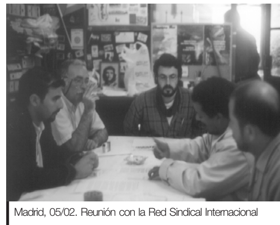
Madrid, 05/02. Reunión con la Red Sindical Internacional

dad, yo lo veo como el cielo para los católicos: que cuando te mueras, iras al cielo. Y no; eso hay que hacerlo cada día, y eso significa labor política. Y labor política es un proyecto político y éste hoy, en la etapa de la globalización, debe tener en cuenta la dimensión y la lucha internacional, - no lo digo porque sea el nombre del partido- y que eso se gana con democracia obrera, y peleando porque las instituciones tipo sindicatos sean cada vez más de clase, no comunista, socialista, anarquista... no, de clase,... y eso ¿quién lo defiende hoy? Yo leo; no es que pasabais por allí. ¿Y por qué vosotros? Pues porque sois cohe-