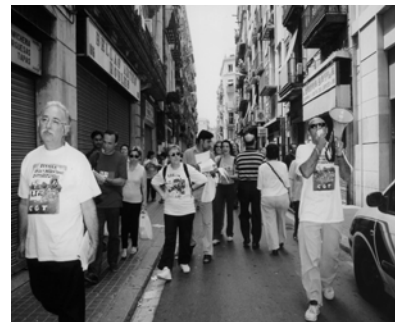
Piquete del 20J

Volviendo a la necesaria continuidad de la huelga del 20 junio, el SOC es el primero que ya dispone de una convocatoria, Diego Cañamero, adelantó que “ la Asamblea General de dicho sindicato ha decidido iniciar el próximo 11 de julio una marcha a Madrid para montar una acampada indefinida en la capital madrileña en señal de protesta por el decreto sobre el desempleo aprobado por el Gobierno que preside José María Aznar. ” Este debiera ser un objetivo de todo el movimiento obrero, hay que preparar una gran marcha a Madrid . Hay también convocatorias de manifestaciones el 15 y 16 de julio y para setiembre y octubre, pero lo que se precisa es un plan de lucha que coordine realmente a todos los que estamos por parar al Gobierno, un plan unitario , sin exclusiones, que dé continuidad a la huelga del 20 de junio.