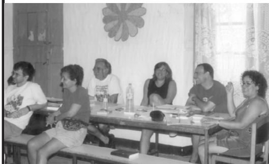
Uno de los grupos de trabajo

A lo largo de cuatro días, con unos treinta participantes y como cada verano se realizó la escuela de Lucha Internacionalista. Este año el tema de debate fue "La lucha contra el fascismo, hoy". Se analizaron las experiencias de los años treinta de Alemania y de la Guerra Civil española. En los dos casos interesaba muy concretamente además de las características concretas del desarrollo del fascismo el debate vivo que se que produjo en las organizaciones de izquierda de como enfrentarlo. Posteriormente se estudió la situación en la Europa actual para permitir una nueva reconstrucción de los movimientos de extrema derecha y las dificultades que podíamos encontrar respeto a los años treinta. También la particularidad con la cual el proceso de reconstrucción se está produciendo en el estado español. En como enfrentar este proceso se analizó las diversas posiciones que la izquierda francesa se planteaba para parar Le Pen, y particularmente el intenso debate en las recientes elecciones presidenciales.