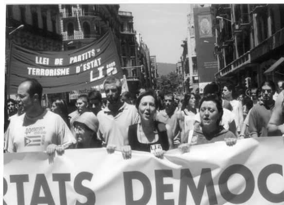
Barcelona, manifestación del 16 de junio

La próxima cita es el 11 de septiembre, Diada nacional de Catalunya, donde se participará tanto en los actos del 25 aniversario en el Fossar como en un bloque unitario contra la ilegalización, en la manifestación de la tarde. Como LI, allí estaremos y ahí os esperamos.