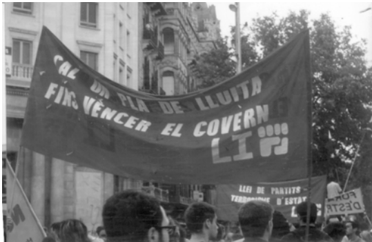
BCN 20J- Es necesario un plan de lucha hasta vencer al gobierno

En octubre se iniciará el trámite para que el decretazo tome forma de ley. Para el 5, está convocada la marcha a Madrid por parte de CCOO-UGT. CGT parece prepararse para participar. Sin embargo todo ello puede quedar en mero testimonio sino se asienta en las asambleas en los centros de trabajo para que sea asumido por todos los trabajadores. Además es difícil entusiasmar en una lucha que aparezca fraccionada, con acciones puntuales en que no se ve la continuidad hasta echar atrás el plan del gobierno. Por eso, ya en julio decíamos que era preciso un plan unitario, sin exclusiones que diera continuidad a la huelga del 20J. Transcribimos la editorial del LI 31 bis de julio 02.