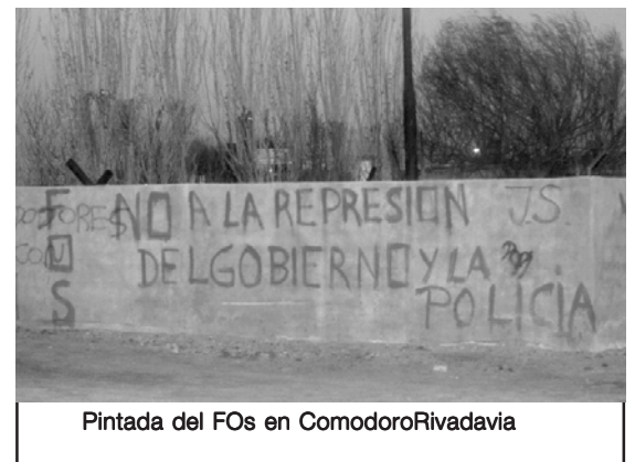
Pintada del FOs en ComodoroRivadavia

genera entonces es la distribución. El criterio es persona movilizada, persona que retiraba algo. Pero cada asamblea por barrio decidía qué hacer con la cantidad de bolsones que le tocaba por los que había movilizado. Allí se decidía por ejemplo que las personas enfermas siempre se cuentan como presentes, casos especiales de gente que estuviera haciendo un laburo -una changa- que no pudo asistir, o gente que no participa pero necesita mucho, entonces se pone todo a consideración de la asamblea y se reparten los bolsones del barrio entre los que fueron y aquellos casos que ha considerado la asamblea. Así que si se han traído 50 bolsones pero las personas que ha votado la asamblea suman 57 o 58, se reparten los 50 entre 57 o 58 partes. Después se forma una comisión que es la que va a entregar y hacen firmar para constatar que se entregó. Pero no siempre vamos por alimentos, sólo