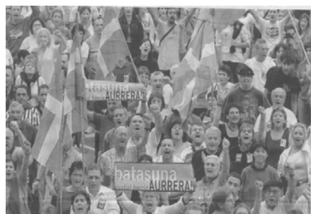
Última mani "legal" de Batasuna. 24/8/02

Es en las decisiones estratégicas donde las palabras dejan lugar a los hechos y donde no hay espacio para posiciones intermedias. Las