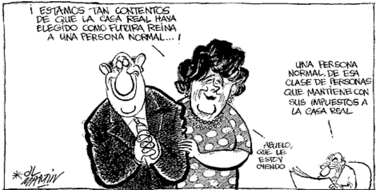
Kap en La Vanguardia