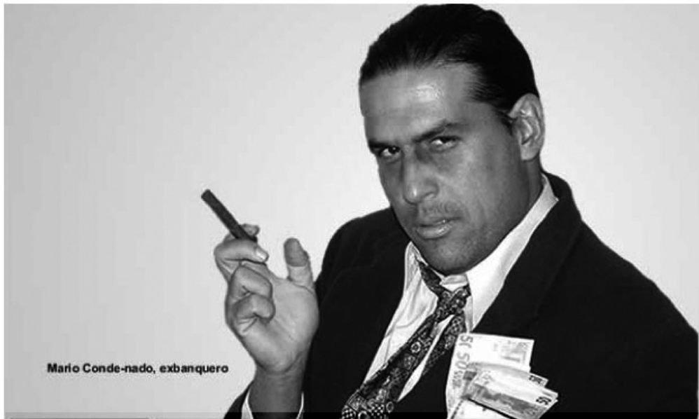
Mario Conde-nado, exbanquero