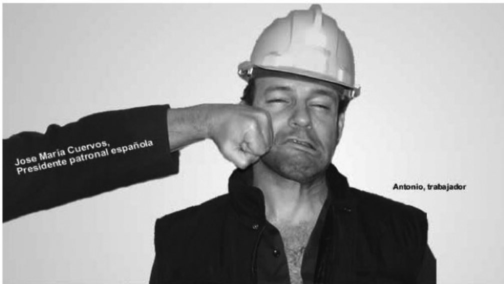
Jose María Cuervos, Presidente patronal española

Vale, ya lo entiendo, antes se llamaban "servicios públicos", pero "servicios de interés económico general" está más cerca de la privatización, y sin mucho alboroto, ¿no? Y atención: la UE no garantizará el acceso a estos servicios, solo los ' reconocerá y respetará ', como quien te da unas palmaditas en la espalda... y los dejará a la voluntad de cada país.