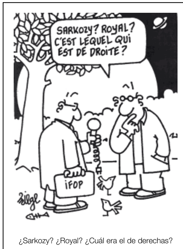
¿Sarkozy? ¿Royal? ¿Cuál era el de derechas?

Presentada en los medios de comunicación como un a organización trotskysta, la LCR por su parte no se reivindica jamás públicamente como tal. Efectivamente es partidaria de la "democracia hasta el final", ha renunciado a la dictadura del proletariado y al centralismo democrático. También la LCR hace eje en todas sus campañas en la "Europa social" y la regionalización, sin jamás exigir la anulación de los tra-