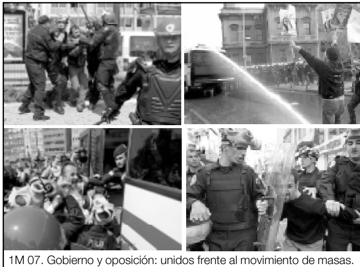
1M 07. Gobierno y oposición: unidos frente al movimiento de masas.

tablecer en el país los derechos y libertades democráticos.