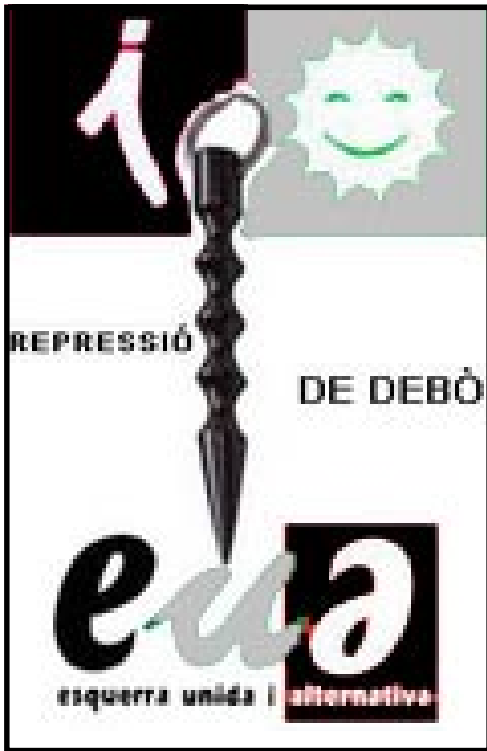
Iniciativa por Catalunya (ic) Izquierda Unida i Alternativa (eua): Represión de verdad