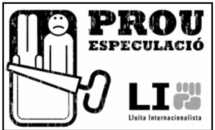
¡Basta de especulación!