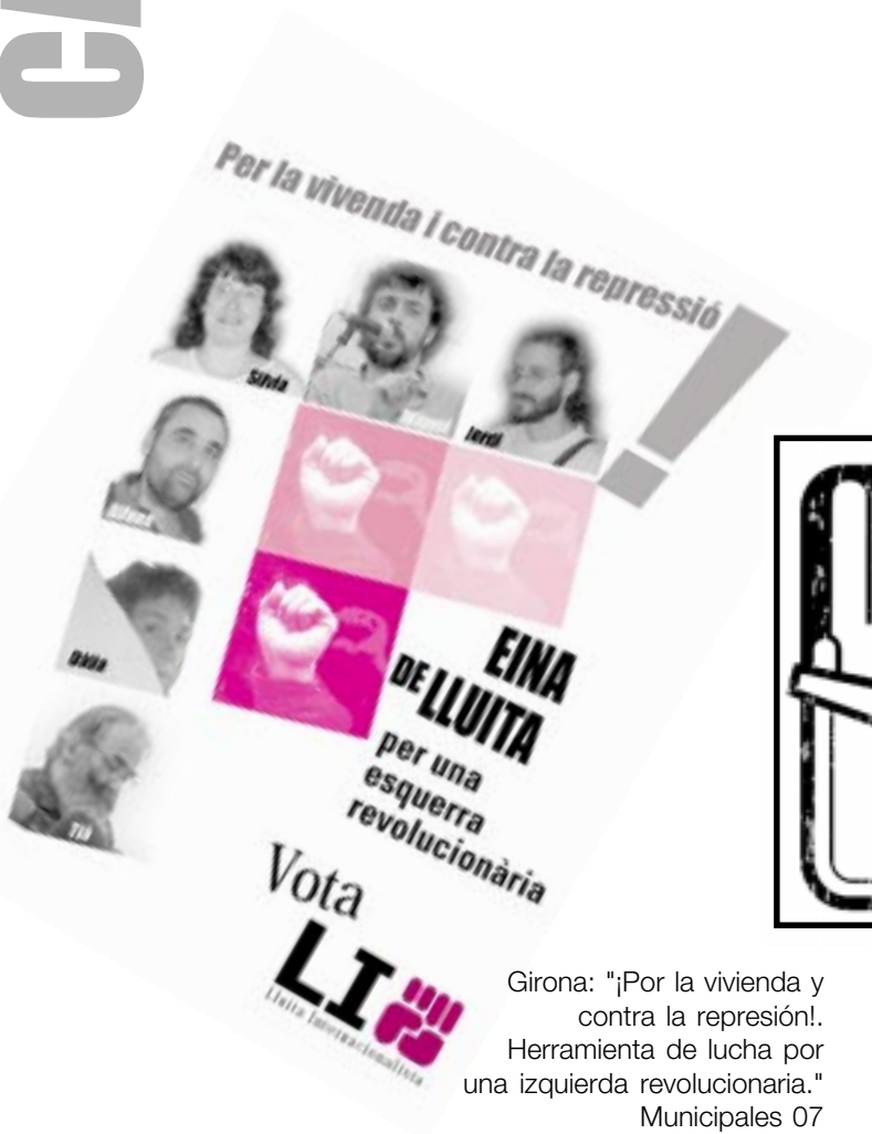
Girona: "¡Por la vivienda y contra la represión!. Herramienta de lucha por una izquierda revolucionaria." Municipales 07