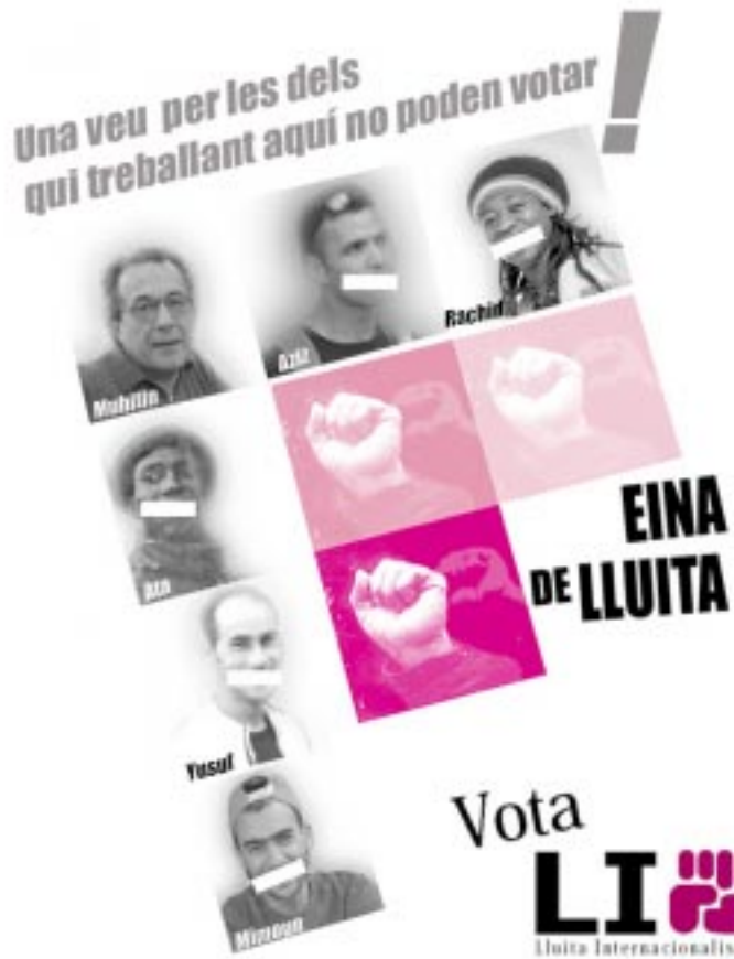
Barcelona "Una voz por las de quienes trabajando aquí no pueden votar!. Herramienta de lucha". Municipales 07