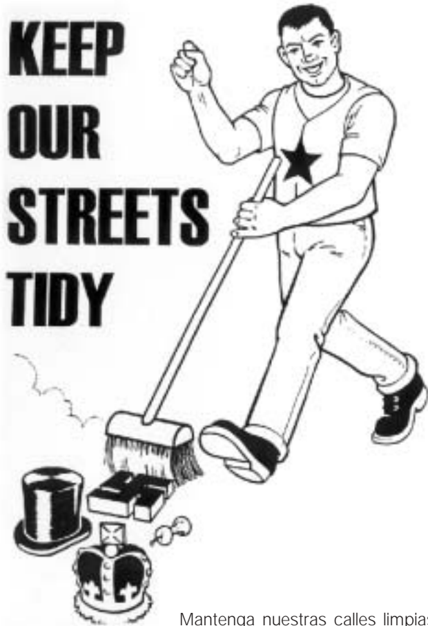
Mantenga nuestras calles limpias

Audiencia- pero provocan la absurda situación de no dejarles ir hacia el Juzgado (!) porque no se quitan la camiseta en que hay escrito “yo también quemé la corona española” y les retienen al pie del bus. Finalmente la policía tiene que ceder, y la camiseta va a ser la primera controversia del día con el facha juez Honrubia; la segunda fue porque –esta vez sí, véase el LI82- tuvo que dejar que hubiera un interprete de catalán que les permitiese entender a los y las imputadas que ejercían su derecho a hablar en su lengua, pero nada le impidió burlarse