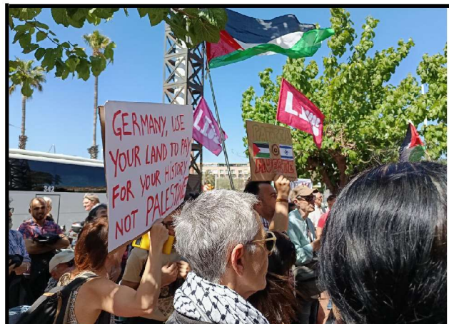
14/4/24. Concentració de resposta davant el Consulat alemany a Barcelona

Unidad Internacional de Trabajadoras y Trabajadores - Cuarta Internacional