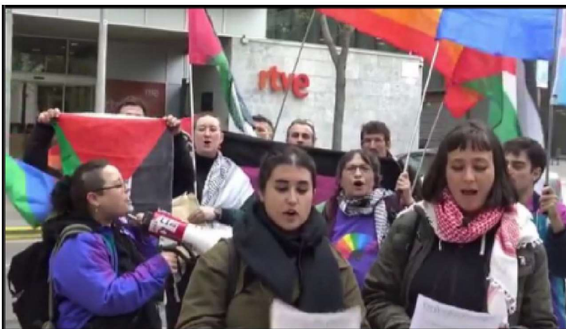
Les companyes de Lluita Internacionalista a la concentració del 26/4/2024 davant TVE contra presència israeliana a Eurovisió