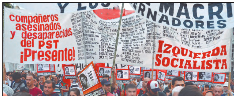
El PST tuvo más de 100 compañeros asesinados, tantos como nombres lleva la pancarta de IS y fotos portan sus militantes, cada 24M.

Hoy, desde IS continuamos la senda del glorioso PST, (...)