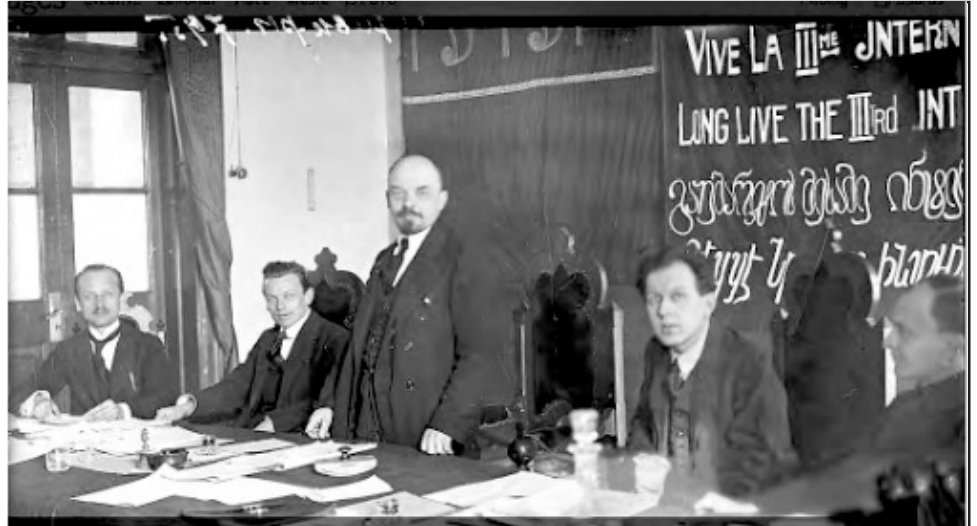
El 2 de marzo de 1919 se fundó la III Internacional. En la foto Lenin en una de las sesiones

Mientras tanto, las viejas direcciones de los partidos socialdemócratas de todos los países europeos, agrupadas en la II Internacional, entraban en crisis por haber apoyado cada uno a su gobierno en la guerra imperialista. Y, terminada la guerra, por traicionar las revoluciones que estallaban en varios países de Europa Central, siendo el caso más destacado el alemán, donde la socialdemocracia fue cómplice del asesinato de Karl Liebknecht y