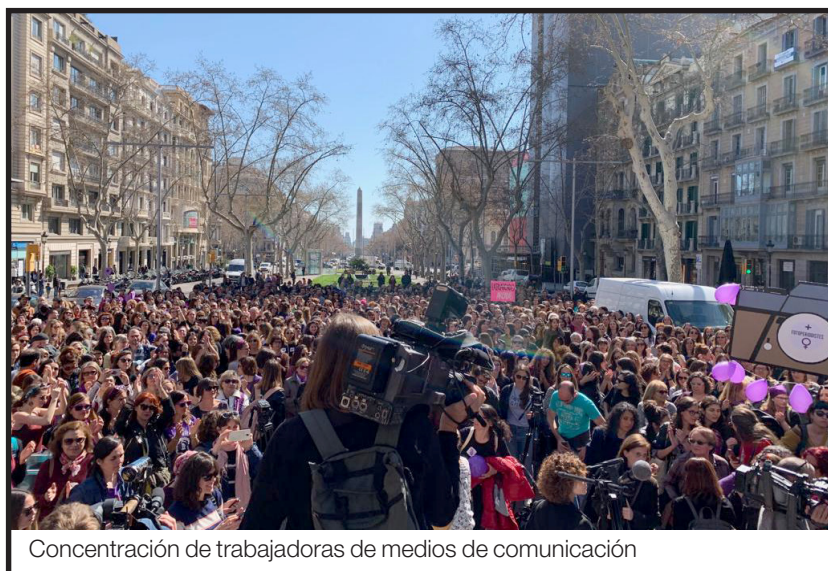
Concentración de trabajadoras de medios de comunicación

gación de la ley de extranjería, por el cierre de los CIEs y contra el racismo y la xenofobia institucional. Los gritos de «No pasarán» y «Ni un paso atrás» se han hecho sentir con fuerza, en un contexto de ascenso de la extrema derecha y de las políticas reaccionarias.