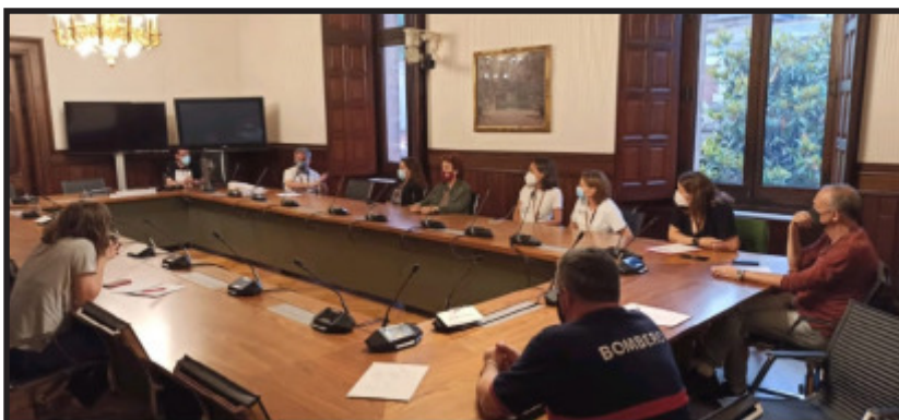
El 4/06/2021, las subcontratas de Nissan, Servi Securitas (bomberos), Altran, Aubay, Snop y Tecnove, se reunieron en el Parlament con el grupo parlamentario de la CUP-G.

El Gobierno había cifrado en 1.260 millones el coste total de la salida de Nissan de las tres factorías: 600 para despidos, 310 para amortizaciones, 250 para cerrar San Andreu de la Barca y Montcada i Reixac, 100 más por los costes derivados de los contratos de los terrenos. De momento en las últimas cuentas Nissan aprovisiona sólo 63,5 mi-