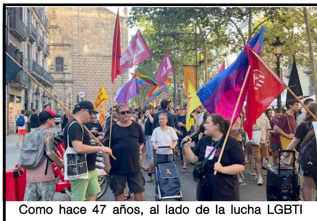
Como hace 47 años, al lado de la lucha LGBTI