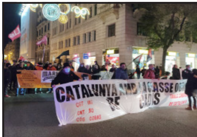
La solidaridad se ha extendido como la pólvora. Concentración en Barcelona convocada por la Taula Sindical alternativa, 27/11/21

Otra problemática es la reparación de barcos a cargo de trabajadores alojados en otros barcos anclados en el