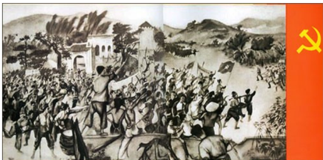
Xô Viết - Nghệ Tĩnh, cao trào cách mạng do Đảng Cộng sản Đông Dương lãnh đạo năm 1930-1931. The Nghe Tinh Soviet movement of 1930-1931, the high tide of the Vietnamese revolution led by the Communist Party of Vietnam

Sin embargo, la IC había iniciado el rumbo ultraizquierdista sectario del «tercer período». En Occidente, insurrecciones «proletarias» sin la mayoría de la clase obrera y atacando a los socialdemócratas como «socialfascistas»; y en Oriente, fundar «soviets» campesinos también sin apoyos. Así, Hồ Chí Minh, empujó al movimiento campesino de reivindicaciones económicas hacia la insurrección para derribar al imperialismo colonial, y tomar el poder, creando soviets campesinos en Ha Tinh y Nghe An, expropiando y repartiendo la tierra en 1930-1931. Ahogados en sangre con bombardeos sobre la población y el PCI casi destruido, se desató un auténtico reino de terror por todo el país.