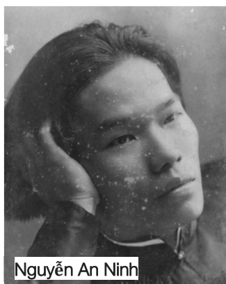
Nguyễn An Ninh

Se formó para las elecciones municipales de Saigón, en abril de 1933, alrededor del reconocido revolucionario independiente Nguyễn An Ninh 7 , con el periódico La Lutte