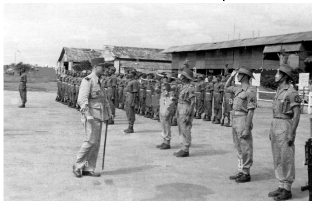
General Leclerc pasando revista a los gurkas del ejército británico

El 5 de octubre, llegaron los refuerzos franceses con el general Leclerc, dispuesto a “restaurar el orden” y “construir una Indochina fuerte dentro de la Unión Francesa”. En los meses siguientes, los franceses recuperaron el control de Vietnam con el consentimiento del Việt Minh . En marzo de 1946, Hồ Chí Minh firmó un acuerdo para recibir a los