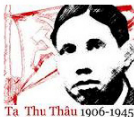
Ta Thu Thâu 1906-1945