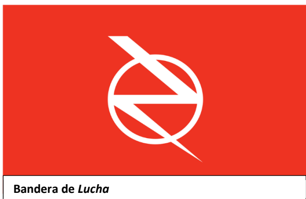
Bandera de Lucha

Muoi (Octubre) como órgano teórico y el Ta doi lap tung thu (Ediciones de la Oposición de Izquierda) difundiendo clásicos marxistas en vietnamita. Fue quebrado por la represión en 1932: la policía política detectó las «imprentas». 65 militantes y simpatizantes fueron detenidos, unos treinta en Saigón 6 . El movimiento de masas estaba en un fuerte reflujo, casi aniquilado por la reacción francesa.