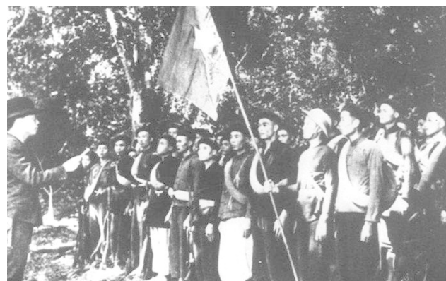
«Guardia republicana» del Việt Minh en Saigón