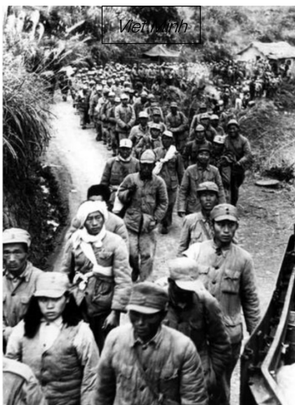
Detenciones masivas francesas